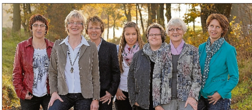
Das engagierte Team von Benjes-Immobilien: Kompetenz und Fingerspitzengefühl.

Spätestens dann sollte über Alternativen nachgedacht und in diese Überlegungen auch ein Verkauf der eigenen Immobilie einbezogen werden. Das hieß zwar, Abschied zu nehmen