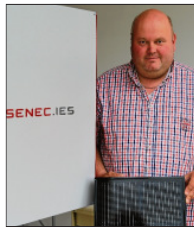
Heiner Meyer-Raaf

die Sonne gerade mal nicht scheint. Erweitert man jetzt beispielsweise die Fotovoltaikanlage und den Stromspeicher um eine Wärmepumpe, kann durch den selbst erzeugten Strom eben diese auch betrieben werden. „Auf diese Art kann es möglich sein, bis zu 75 Prozent Unabhängigkeit vom örtlichen Stromanbieter zu erreichen“, erklärt der Ener-